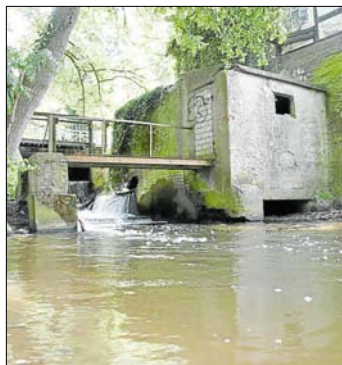
Feste, Flora und Fauna, Menschen, Lieblingsorte, alles ist erlaubt. Der Heimatverein möchte mit seiner Fotoaktion im Jahr der Stadtwerdung ein Archiv aufbauen und eine Ausstellung auf die Beine stellen.