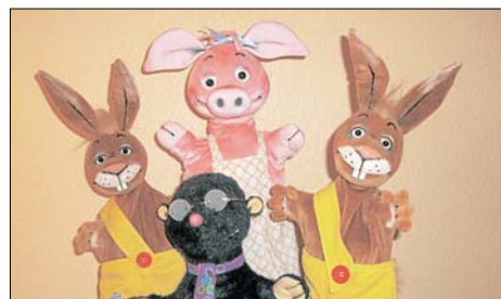
Die frechen Osterhasenkinder Hoppel und Stoppel treiben Schabernack mit Frau Sau-Ber und dem Maulwurf Grabowski. Zu erleben ist das am Sonntag in der Puppentheater-Aufführung in der Realschule.

Die Aufführung dauert rund 80 Minuten einschließlich einer Pause. Das Stück ist für Kinder ab drei Jahren geeignet. Zum Inhalt: In Osterhausen geht mal wieder alles drunter und drüber. Es ist kurz vor Ostern, und noch immer müssen viele 100 Eier angemalt werden. Papa Osterhase ist im Stress, denn er muss alles allein machen. Seine Frau ist bei der Oma, um sie nach einer Löffelohrentzündung gesund zu pflegen. Die beiden Kinder des Osterhasen, Hoppel und Stoppel, haben Langeweile. Sie fangen an, Schabernack zu treiben. Ihr erstes Opfer wird der Nachbar, Maulwurf Grabowski. Obwohl er bei Tageslicht nichts sehen kann, ist er gerade dabei, seinen Gartenzaun zu streichen. Da kommt Stoppel eine prächtige Idee... Doch damit nicht genug: Die Nachbarin, Frau Sau-Ber, will ihre Wasche aufhängen. Ob die Kleidung lange weiß bleibt? All das wird am Sonntag geklärt.