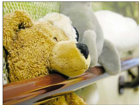
Gedächtnisspiele, Vorlesen und Gespräche lassen die Bewohner der gerontopsychiatrischen Abteilung jeden Morgen zusammenkommen (oben). Hinter den Handläufen klemmen Stofftiere, die den Demenzkranken vielfach treue Begleiter sind.