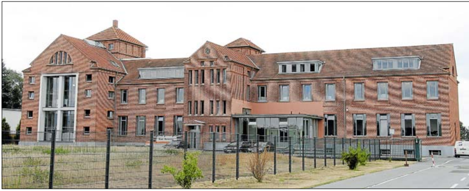
Erst wurden an der Gütersloher Straße 123 Fleischwaren hergestellt, später zog eine Saattgutfabrik ein. Seit etwa zehn Jahren beherbergt das markante Gebäude die Bertelsmann-Tochter BFS finance. Jetzt soll auf der Fläche ein neues Gebäude entstehen.

Der Backsteinbau an der Gütersloher Straße ist in den 20er-Jahren errichtet worden und wurde jahrzehntelang zur Herstellung von Fleischwaren genutzt. Als die Firma Marten nach Gütersloh umsiedelte, zog eine Saattgutfirma ein. Erst danach wurde die Tochter des Bertelsmann-Konzerns dort heimisch.