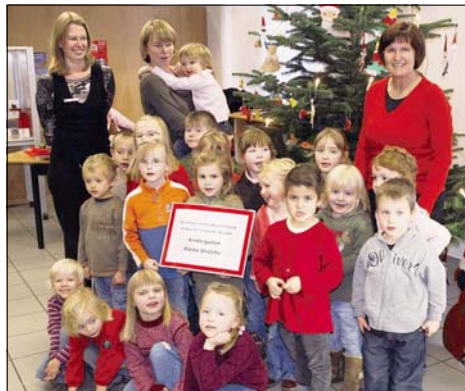
Die Mädchen und Jungen vom Kindergarten „Kleine Strolche“ hatten farbenfrohen Tannenbaumschmuck gebastelt und stellen ihn für die Kreissparkassen-Filiale zur Verfügung.