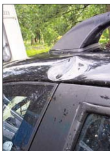
Abgeknickte Äste haben zahlreiche Fahrzeuge beschädigt.