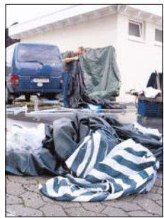
Von den Zelten einiger Aussteller ist nicht mehr allzu viel übrig.