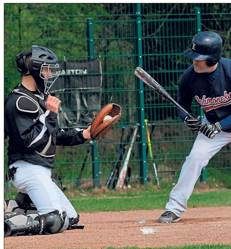
Bälle schlagen und fangen wie die Yaks: Dazu haben Baseballfans am Samstag, 24. Juni auf der Sportanlage am Schmiedestrang die Gelegenheit. Die Yaks feiern dort ihren 25. Geburtstag.