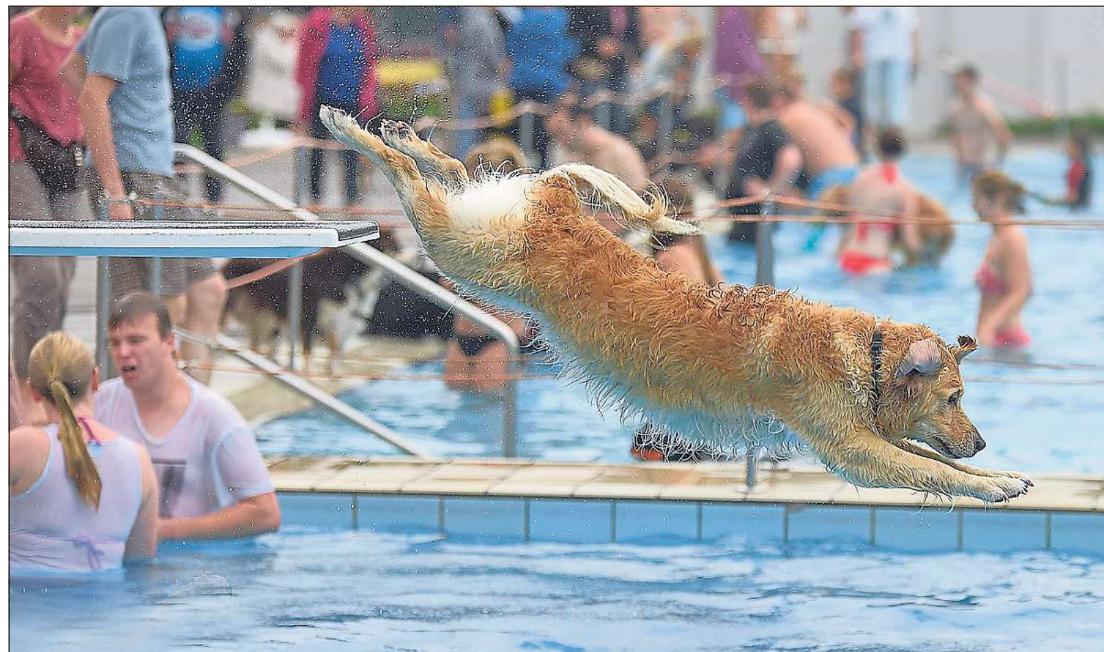
In Rheda dürfen Vierbeiner nach dem Ende der Freibadsaison an einen Tag abtauchen. Nun ist auch in Verl ein Hundeschwimmen geplant. Ein Termin steht noch nicht fest. Das hängt davon ab, wie lange die Einrichtung am Meierhof geöffnet bleibt.