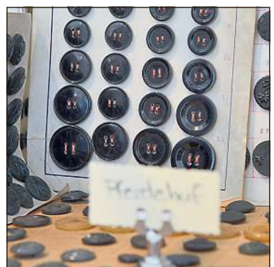
Das Knopfmuseum öffnet während des Verler Lebens.