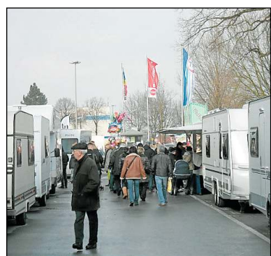
Wohnwagen und- mobile werden in Kaunitz zu sehen sein.