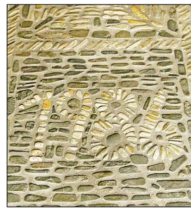
Schlussstein: Aus Kieselsteinen, die den Charakter des Pickstein-Bodens ausmachen, ist das Jahr der Eröffnung des Verler Heimathauses in den Fußboden eingefügt worden: 1986.