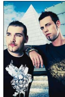
Nach den ersten Musikproduktionen entwickelten sich „2-4 Grooves“ zum Geheimtipp der deutschen House-Szene.