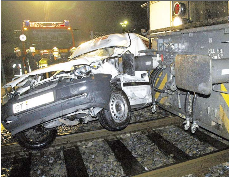
Kollision: Die Lok eines Güterzuges stieß am Montagabend am Bahnübergang Östernweg mit einem weißen Kastenwagen zusammen. Das Fahrzeug wurde aufgrund des Regens beinahe 70 Meter weit mitgeschleift. Der Fahrer des Autos wurde schwer verletzt.

Zwar hängt in Verl nirgendwo ein solches Schild, Werner Kuhlmann hat aber zumindest dafür sorgen können, dass die unbeschränkten Übergänge gut einsehbar gestaltet wurden. Dafür sind an vielen Stellen Sträucher und Hecken massiv zurückgeschnitten worden.