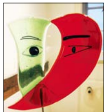
Dieses und andere Windspiele sind im Heimathaus zu sehen.