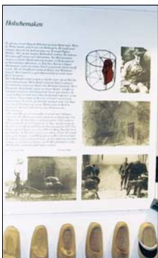
Wie aus einem Holzklötzchen Holzschuh entsteht, zeigen diese Exponate samt Tafel.