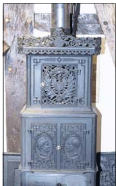
Dieser reich verzierte Ofen, ein Produkt der Holter Eisenhütte, befindet sich im Heimathaus.