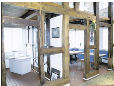
Das Gebälk des Heimathauses sorgte auch für die Bezeichnung „Fachwerk-Konzerte“.