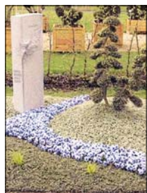
Die Mustergrabanlage des Gartenhofs Echterhoff fand bei der Jury großen Zuspruch.