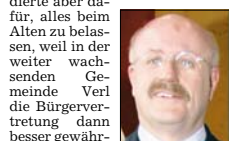
Der amtierende Gemeinderat fungiert ungeachtet des neuen

Vertreter weniger bis zu 20 000 Euro. Das Stadtoberhaupt plädierte aber dafür, alles beim Alten zu belassen, weil in der weiter wachsenden Gemeinde Verl die Bürgervertretung dann besser gewährleistet sei.