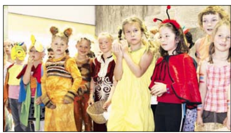
Während ihrer Reise nach Afrika sind „Lilo Schnatterschnute“ und „Flatterphilipp“ von „wilden Tieren“ umgeben.

Kinder- und Jugendnetzwerk im Pastoralverbund: St. Anna: 17 bis 21 Uhr geöffnet für Jugendliche ab 14 Jahren; St. Marien Kaunitz: 14.30 bis 17 Uhr Kindertreff (acht bis zwölf Jahre). Jugendhaus „Oase“: 17 bis 20 Uhr Jugendtreff (ab zwölf Jahren). „Eule“: 14.30 bis 16.30 Uhr im Gymnasium, Informationen beim Caritasverband Gütersloh, ☎ 05241/983315. Grundschule St. Georg: 17 Uhr Theater „Reise um die Welt“.