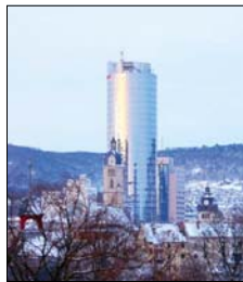
Der Intersport-Tower ist GFR-Referenzobjekt.

gesamte Überwachungs-, Steuer-, Regel- und Optimierungseinrichtung in dem Gebäude. Ob Licht, Luft, Wärme, technische Einrichtungen oder anderes – alles wird elektronisch gesteuert und hinsichtlich des Energieverbrauchs optimiert. „Es bedarf einer sehr komplizierten Regelungsstrategie“, sagt Westerheide. Die schönste Hülle habe schließlich keinen Wert, wenn man sich darin unwohl fühlt.