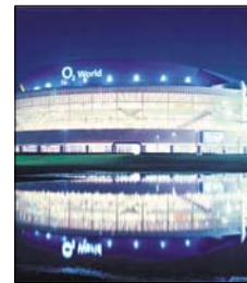
Die 02-World in Berlin hat GFR ebenfalls ausgestattet.