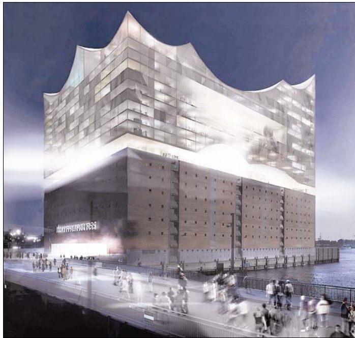
Die Elbphilharmonie in Hamburg: 2012 soll die Konzerthalle mit Hotel, Appartments und Restaurants fertiggestellt sein. Für die Gebäudeautomatisierung zeichnet die Firma GFR verantwortlich.

Die Elbphilharmonie ist eine Konzerthalle, die in der Hafencity entsteht. Die Eröffnung soll im Frühjahr 2012 erfolgen. Das Projekt wird realisiert auf Basis eines ehemaligen Kakaospeichers. Der Entwurf sieht vor, auf dem bestehenden Baukörper einen gläsernen Aufbau mit geschwungener Dachform zu errichten, in dem eine öffentlich zugängliche Plaza in 37 Meter Höhe, zwei Konzertsäle sowie die Mantelbebauung in Form eines Fünf-Sterne-Hotels mit 220 Zimmern, Konferenzzentrum und gastronomischen Betrieben sowie Appartments untergebracht werden.