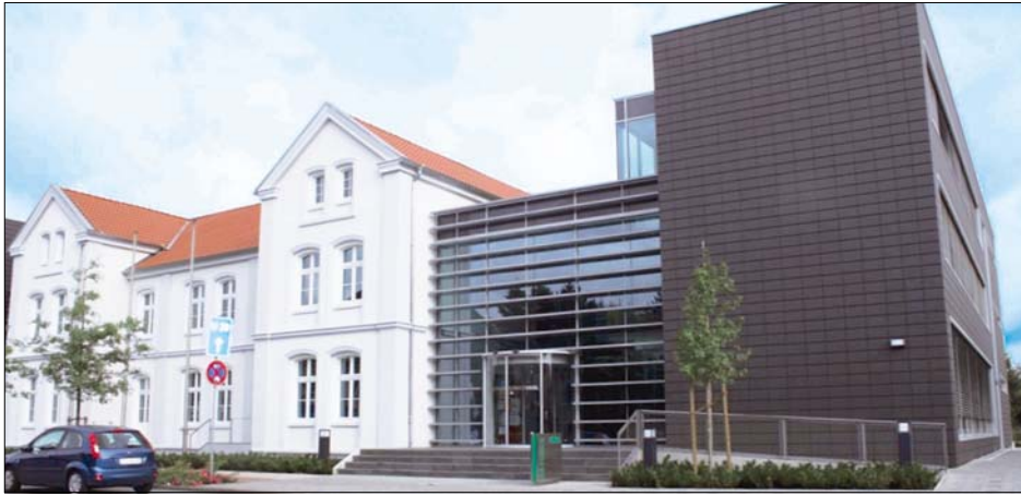
Der Neubau des Verler Rathauses überzeugt nicht nur optisch, sondern auch durch seine hochmoderne Haustechnik. Für Heizung und Klimatisierung fallen 212 Kilowattstunden pro Jahr weniger an als bei einer herkömmlichen Anlage.