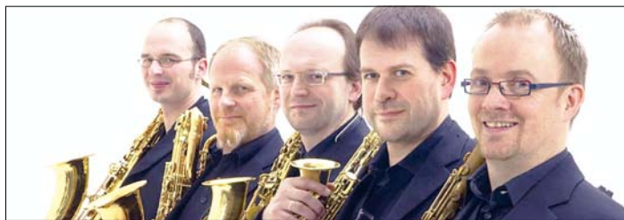
Das Saxophonquintett „Quintessence“ kommt am Sonntag, 31. August, in die Ölbachgemeinde. Der „Verler Sommer“ beginnt um 17 Uhr in der Marienkirche in Verl-Kaunitz.