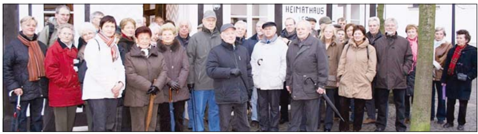
An dem Gang des Heimatvereins nach Kaunitz nahmen rund 50 warm eingepackte Wanderer teil. In Kaunitz angekommen, stärkten sie sich mit Grünkohl.

Das Ziel am Samstagabend war schließlich das „Haus Liemke“.