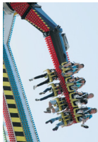
Die Welt dreht sich: Den Fahrgästen bietet sich Verl in ungewöhnlicher Perspektive dar.