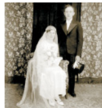
■ Ersteh, sie sitzt: Traditionelles Hochzeitsbild aus Verl um 1935.

graf bekannt, hatte er, bis zuletzt nur mit Glasplattennegativen arbeitend, auf Bestellung hauptsächlich Frauen, Männer, Kinder und während des Krieges auch so genannte Fremdarbeiter abgelichtet. Dazu machte er Aufnahmen von Hochzeitspaaren, fotografierte auf Festen und Versammlungen. Viele Menschen, meist dem Anlass entsprechend herausgeputzt und posierend, sind in dieser Fotogalerie vertreten, Prominente wie Normalbürger.