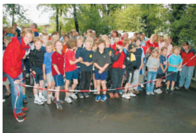
■ Auch die Kleinen wollen lange Beine machen: Voller Vorfreude warten hier einige der insgesamt 60 Kinder auf das Startzeichen. Auch ihr Beitrag trug beim Ungandalaf zum hohen Spendenaufkommen von 3.300 Euro bei.

Nicht nur das regnerische Wetter hatte den vielen Vereins-