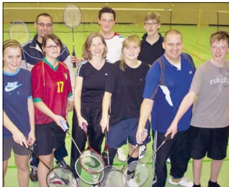
Nachaktive Sportler: Beim Badminton-Turnier in der Zweifachturnhalle hatten nicht nur die Könner sondern auch die Anfänger auf den Plätzen viel Spaß.