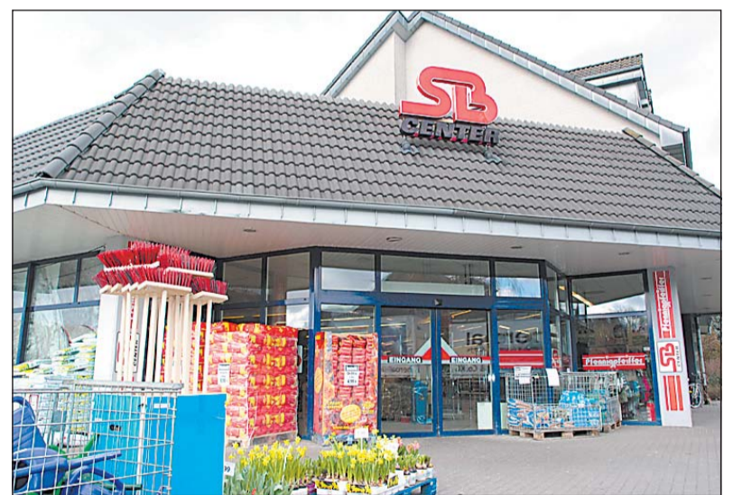
Im SB-Markt hatte der Ladendieb bereits Hausverbot. Trotzdem versuchte er, dort eine Computermaus zu stehlen.

Verl-Kaunitz (WB). Die Ostwestfalenhalle ist morgen, Samstag, wieder Schauplatz für den Hobbymarkt. Zahlreiche Händler bieten ab 5 Uhr Kleintiere und Geflügel sowie Trödel und Neuwaren an. Imbiss- und Getränkestände runden den Markt ab. Wer Trödel verkaufen will, findet ohne Voranmeldung einen Stellplatz. Anbieter von Neuwaren können sich unter ☎ (0 52 46) 96 11 66 über die Platzvergabe informieren.