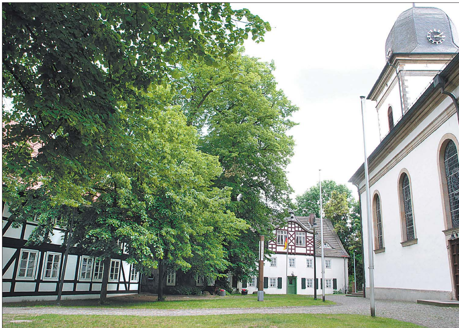
Die Wiege des Ortskerns: Verls gute Stube, der historische Kirchplatz. Hier bekam die ehemalige Streusiedlung mit der St.-Anna-Kapelle vor 500 Jahren ihr erstes Zentrum und hier soll der historische Stadtrundgang beginnen.