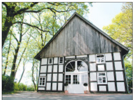
Ein Schatzkästchen: Die Bunten Mühle der Familie Berenbrinker ist wie die Mühle von Sticking an der Dalke Montag geöffnet.